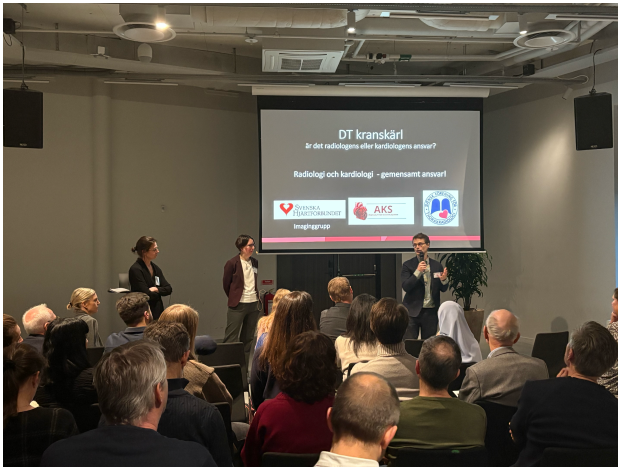
Update Kranskärl 2025 hade temat "Kranskärl i obalans - det vulnerabla placket". Kardiologer från hela landet samlades för att diskutera olika aspekter på vulnerabla plack.